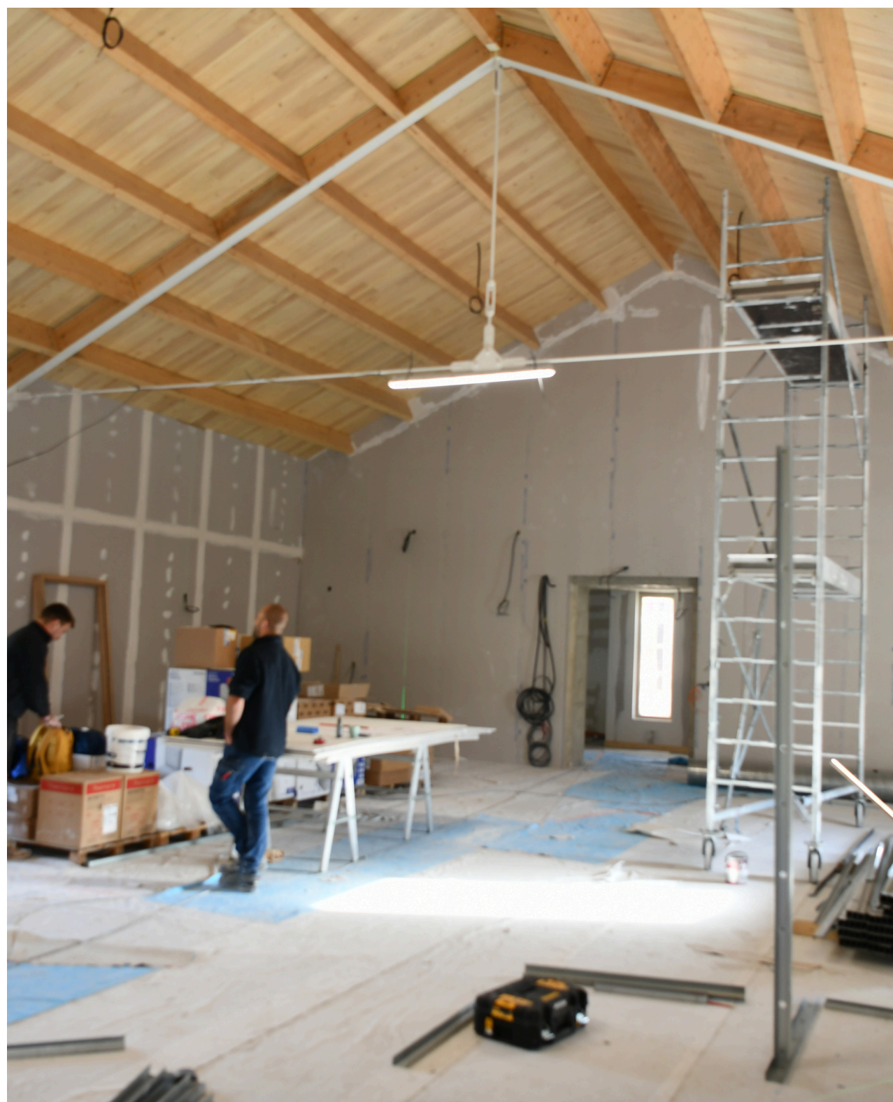
PHOTO DE LA BOUTIQUE EN CHANTIER