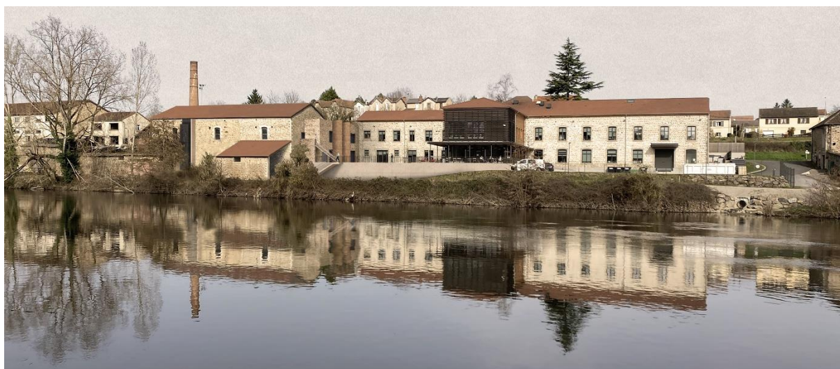
Projection, vue sud